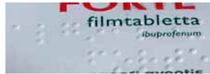
A gyógyszerek dobozán a gyógyszer neve Braille-írással is szerepel.

A morzekódot és a távirót SAMUEL MORSE (ejtsd: szemjuöl morz) találta föl 1835-ben. A betűket ebben az esetben a két állomás közötti vezetéken hosszabb-rövidebb ideig tartó áramlökésekkel helyettesítették. Morse a jelek kialakításánál figyelembe vette a betűk gyakoriságát is. Így például a gyakori E betűhöz rövidebb kódot vezetett be, mint a ritkábban szereplő Y-hoz.