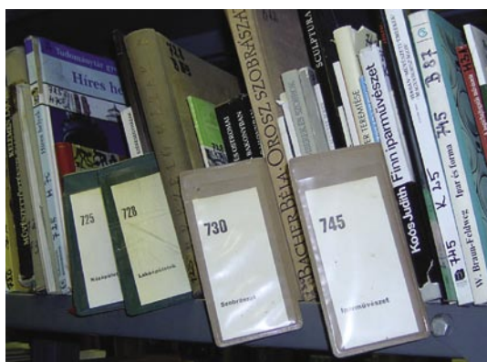
Az ismeretterjesztő könyveket ETO-szám, azon belül Cutter-szám szerint rendezik. Mi az ETO-szám szerepe?