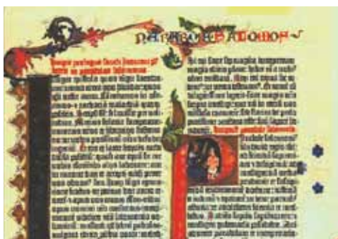
Gutenberg 42 soros Bibliája. Mikor nyomták?

A következő lépést a hang, illetve a látvány rögzítése jelentette. E két terület ma is gyorsan fejlődik. Edison fonográfja helyett ma már MP3-lejátszót használunk; a kémiai úton előhívott papírképeket kiszorították a digitális képek; a filmszalag mellett pedig előbb a videoszalag jelent meg, majd a DVD-lemez.