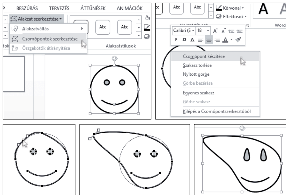
Az átalakítás lépései. Próbáljuk ki a többi görbeszerkesztési műveletet is!