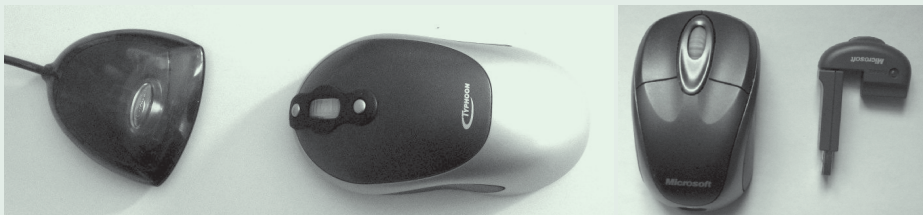
Vevőegység és egér

Vezeték nélküli* kapcsolódás esetén valójában két berendezésről beszélünk. Egyik maga az egér, a másik a számítógéphez vezetékkel csatlakozó, az egér által sugárzott jeleket észlelő vevőegység.