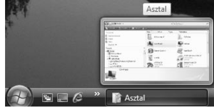
Ablak kicsinyített képe

Az ábrán megfigyelhetjük, hogy a start menü és az ablak kerete alatt áttűnik az asztal képe. Vegyük észre, hogy a tálca egy gombja felett megállva láthatjuk az ablak kicsinyített képét.