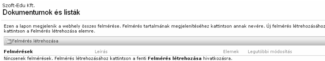
14.1. ábra: Felmérés létrehozása

Első lépés: az Új felmérés lap kitöltése (14.2 ábra)