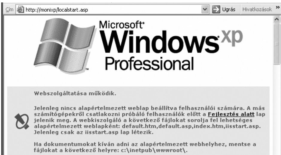
Frissen telepített webszerver nyitólapja

Az összetevők listájából keressük meg az Internet Information Services (IIS) sort, és kattintsunk az előtte található négyzetre. Ekkor formájú lesz a jelölő, és ennek megfelelően az ág alatt található komponenseknek csak egy része lesz kiválasztva telepítésre. Ezek az alapértelmezetten kiválasztott komponensek további munkánkhhoz már elegendőek. Gépünk kérni fogja a WindowsXP telepítőkészletét tartalmazó CD-t, majd rövid várakozás után rendelkezésünkre áll a webszerverünk.