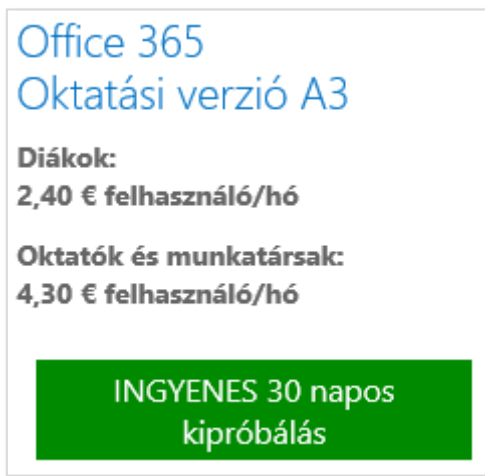
47. ábra: Regisztráció a 30 napos próbaverzióra

A megjelenő űrlapon a személyes adatok kitöltése után meg kell adnunk a leendő Office 365 rendszerünk tartománynevet. Amíg nem állítunk be saját domain nevet, addig ennek segítségével tudunk bejelentkezni a rendszerbe.